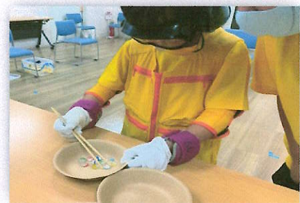
おはじきつかみ体験