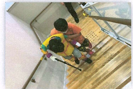
階段の上り下り・介助