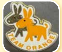
＜チームオレンジバッジ＞

※ステップアップ講座の受講者にはサポーターの証として「チームオレンジバッジ」をお渡します。