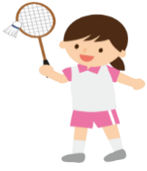
ラケットとシャトル